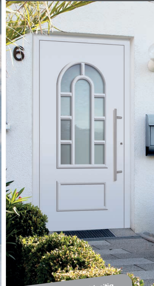
A 555190 / K 550890