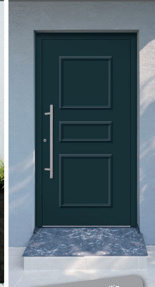
A 555176 / K 550876

inkl. MwSt. zzgl. Nebenkosten (z.B. Montage, Zubehör)