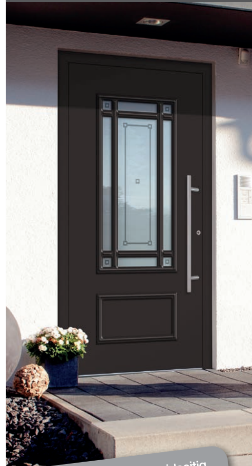
A 555117 / K 550817

inkl. MwSt. zzgl. Nebenkosten (z.B. Montage, Zubehör)