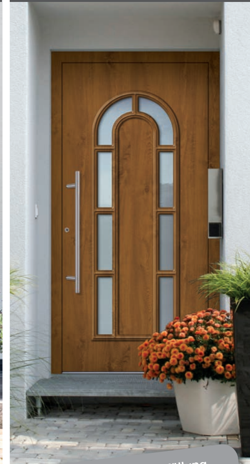
A 555160 / K 550860

inkl. MwSt. zzgl. Nebenkosten (z.B. Montage, Zubehör)