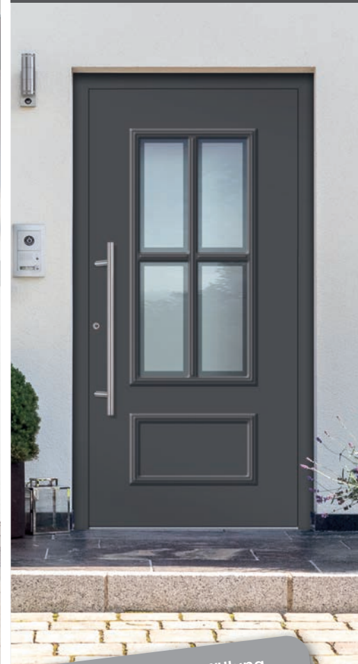
A 555150 / K 550850

inkl. MwSt. zzgl. Nebenkosten (z.B. Montage, Zubehör)